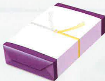
葬儀・法事の返礼品