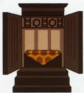
仏壇・仏具の事なら何でも