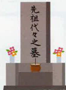
墓石の建立から戒名彫りまで