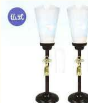
ほのか黒塗 [一对] H85cm 22,000円 (税抜)20,000円