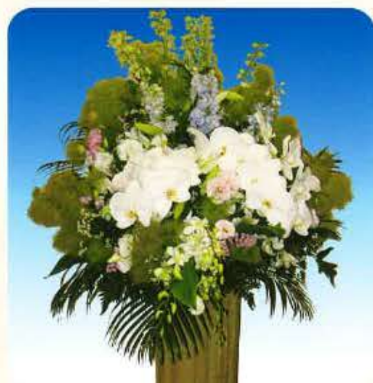
洋③ [一基] 22,000円 (税抜)20,000円