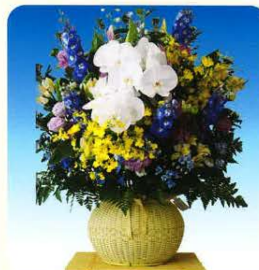
一对 66,000円 (税抜)60,000円