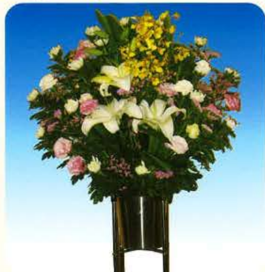
和① [一基] 11,000円 (税抜)10,000円