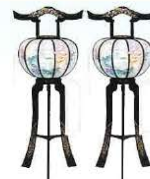
水瀬本黒塗 秋草中 [一对] H100cm 27,500円 (税抜)25,000円