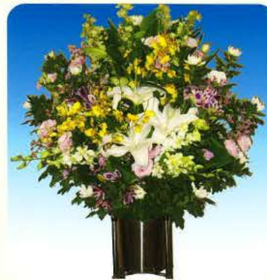
一对 33,000円 (税抜)30,000円