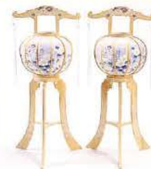
香澄灯 [一对] H85cm 16,500円 (税抜)15,000円