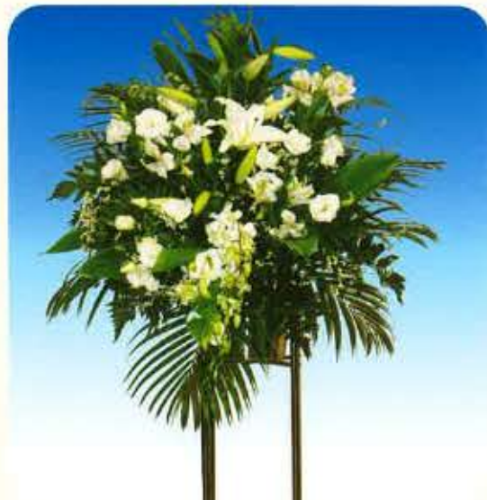
洋① [一基] 11,000円 (税抜)10,000円