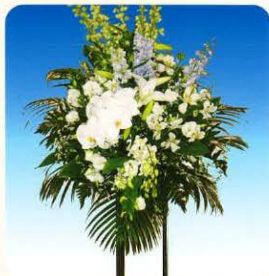
洋② [一基] 16,500円 (税抜)15,000円