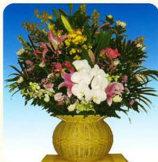
和③ [一基] 22,000円 (税抜)20,000円