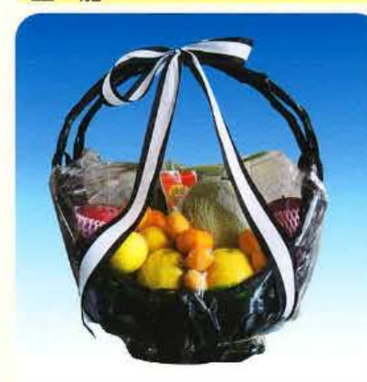
盛籠 10,800円 (税抜)10,000円