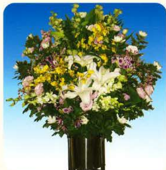
和② [一基] 16,500円 (税抜)15,000円